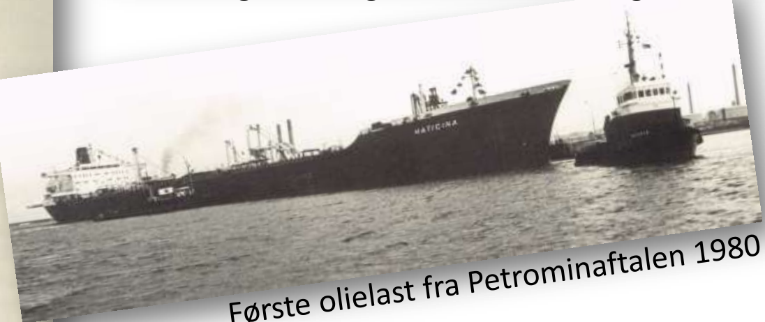
Første olielast fra Petrominaftalen 1980