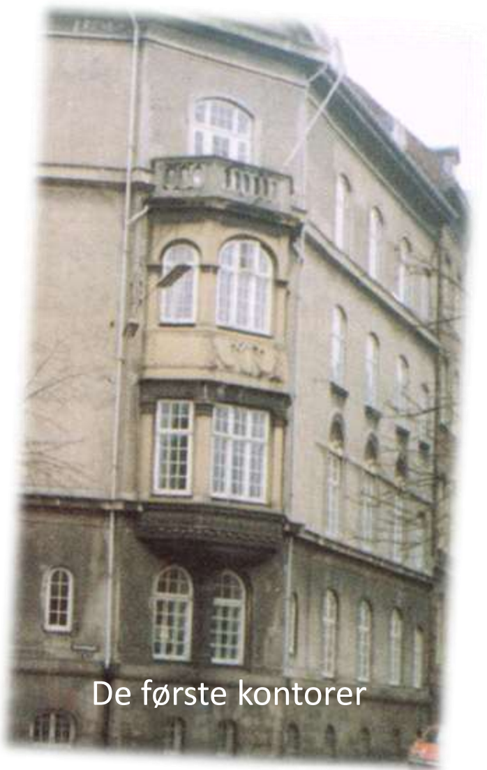
De første kontorer