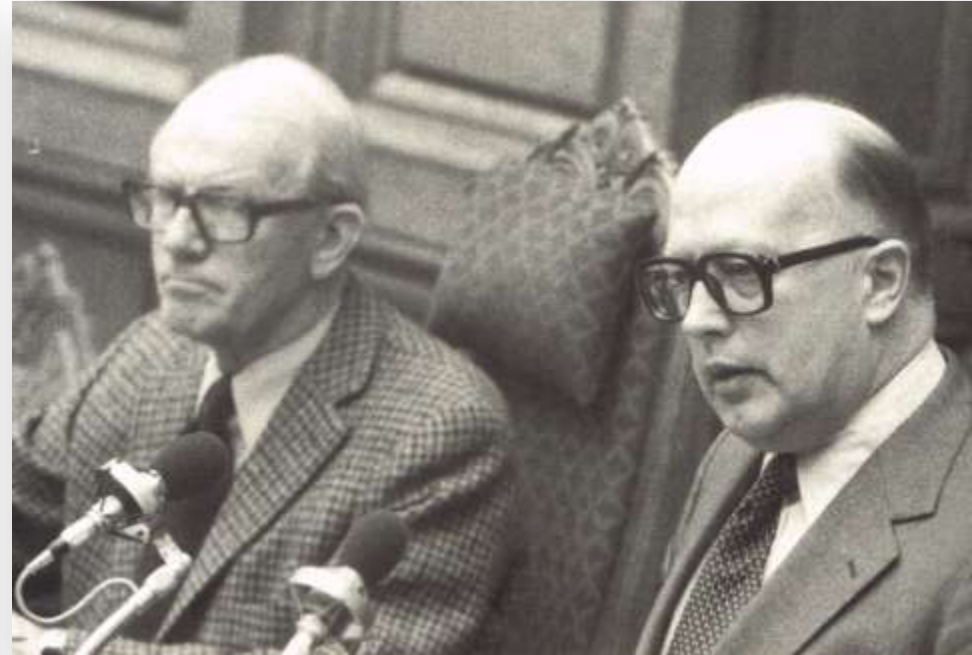
Folketinget vedtager at indføre naturgas 1979