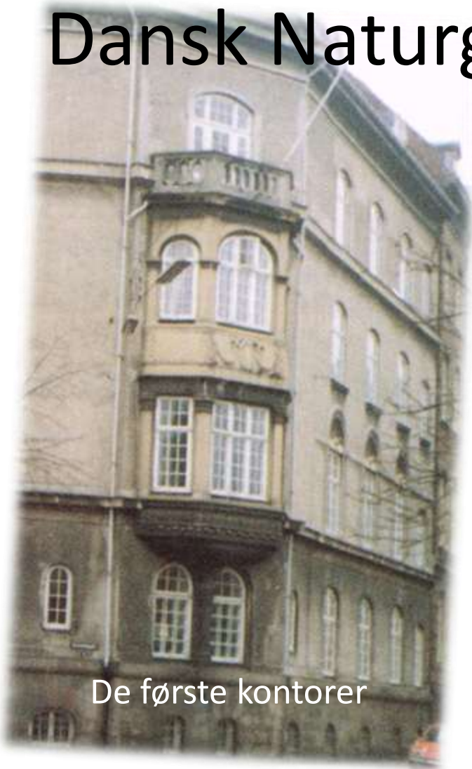
De første kontorer